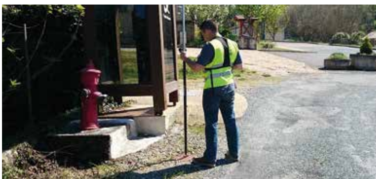
Scanéo aide les collectivités et les exploitants