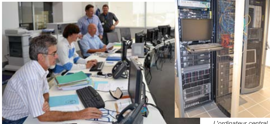
La «tour de contrôle» du groupe, où les «trafic managers» suivent les déplacements en temps réel grâce à la géolocalisation (4 000 opérations de transport par jour en France et à l'international).

« La présence des entreprises de transport s'accroît sur le territoire de la CAP, du fait de l'aménagement de parcs d'activité sur des axes stratégiques, en bordure de l'autoroute et sur la route de Limoges, à Trélissac. C'est le cas par exemple de la société Concept Logistique Service , l'une des premières à s'installer sur le site de Cré@vallée sud, en 2002, qui a essaimé une activité de messagerie frigorifique en 2006 (cf Cap forum n°30). Le parc de Borie Porte, à Trélissac, conçu par la CAP pour rassembler les concessionnaires auto, attire aussi des transporteurs. Ces zones de fret affichant complet, un projet d'agrandissement est en cours à Cré@vallée sud, en direction du bourg de Notre-Dame de Sanilhac, pour accueillir d'autres entreprises de transport, fret et logistique, sur un site particulièrement adapté, à proximité de l'A89 ».