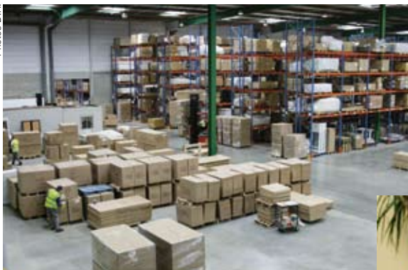
L'espace : le secret de la logistique