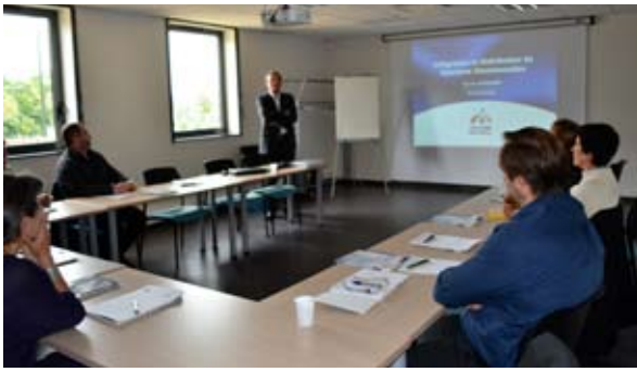
Lors de la journée Portes ouvertes à la Pépinière, en juin dernier